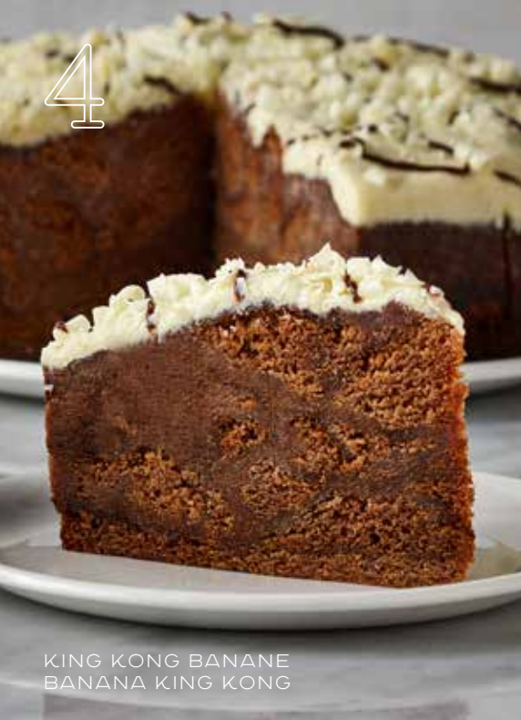
KING KONG BANANE BANANA KING KONG