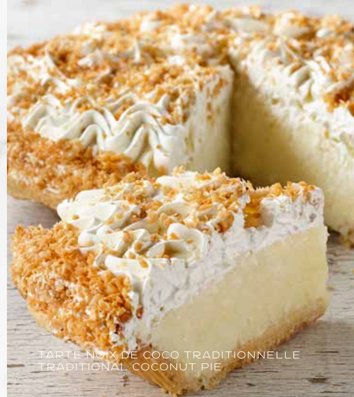
TARTE NOIX DE COCO TRADITIONNELLE TRADITIONAL COCONUT PIE