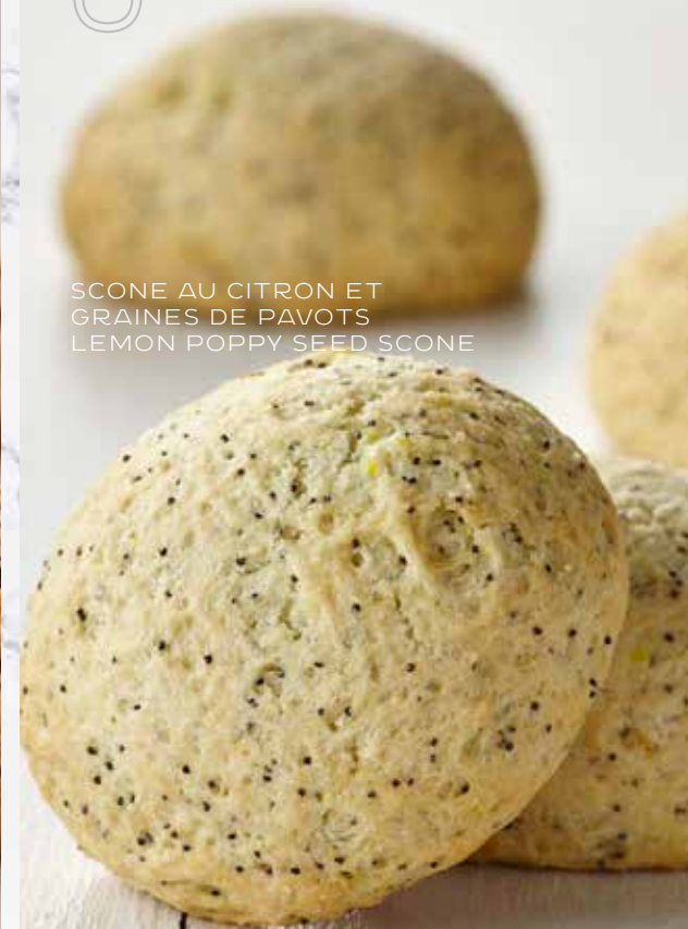
SCONE AU CITRON ET GRAINES DE PAVOTS LEMON POPPY SEED SCONE