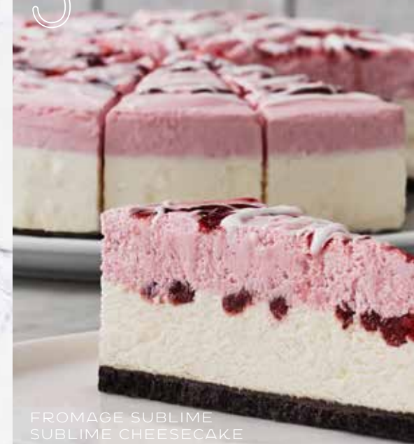
FROMAGE SUBLIME SUBLIME CHEESECAKE