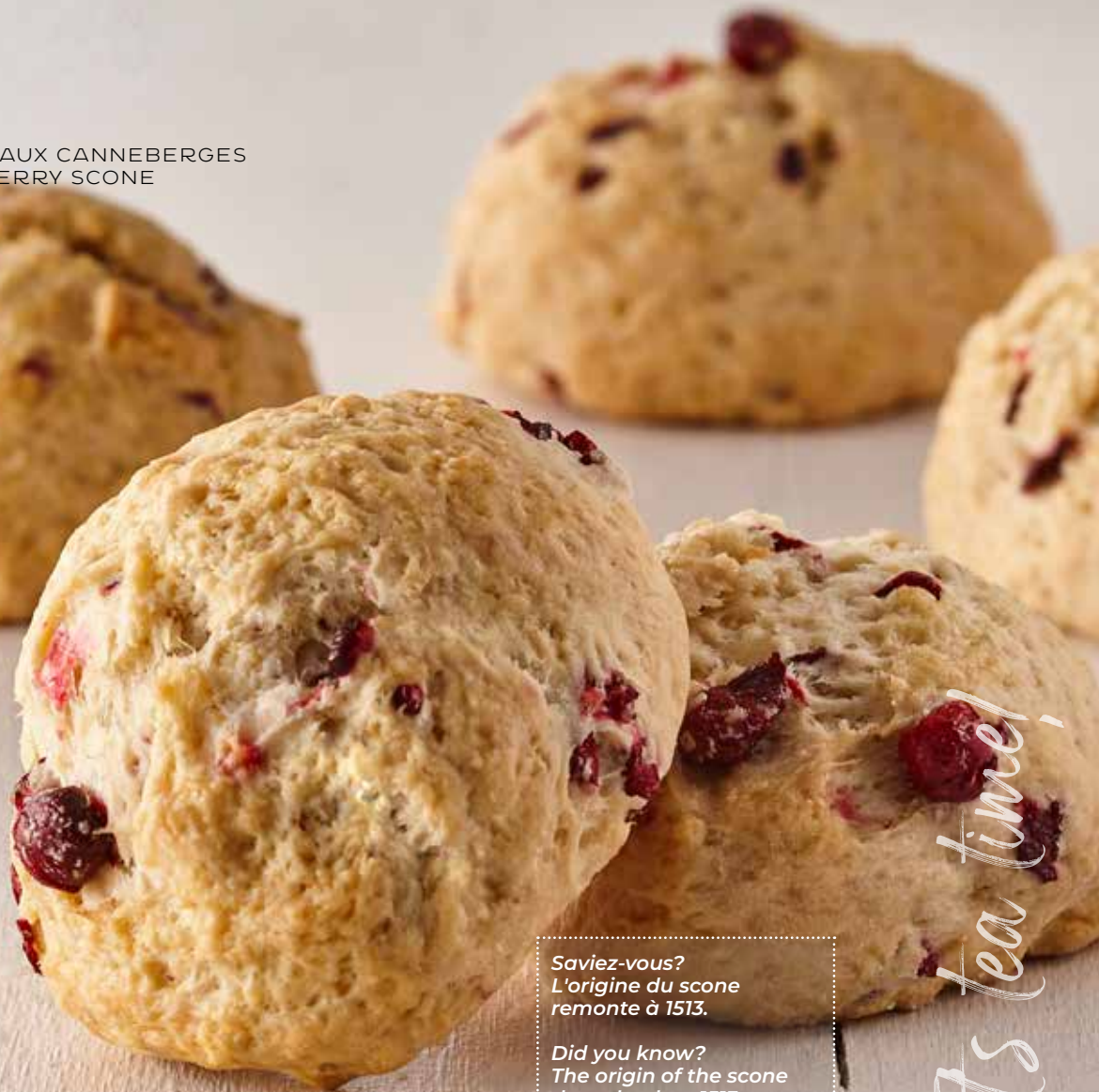
SCONE AUX CANNEBERGES CRANBERRY SCONE

Saviez-vous? L'origine du scone remonte à 1513.