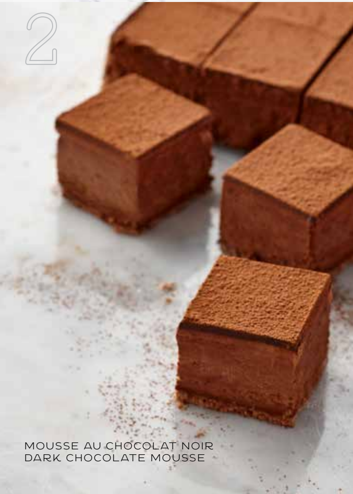
MOUSSE AU CHOCOLAT NOIR DARK CHOCOLATE MOUSSE