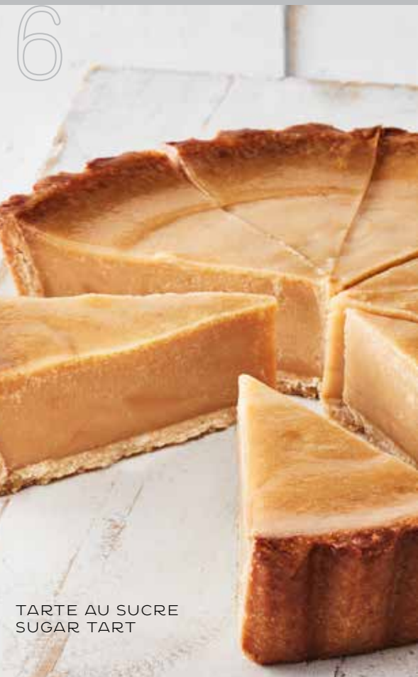
TARTE AU SUCRE SUGAR TART