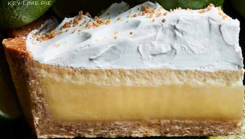
TARTE KEY LIME KEY LIME PIE

Saviez-vous? La première recette de tarte a été publiée par les Romains.