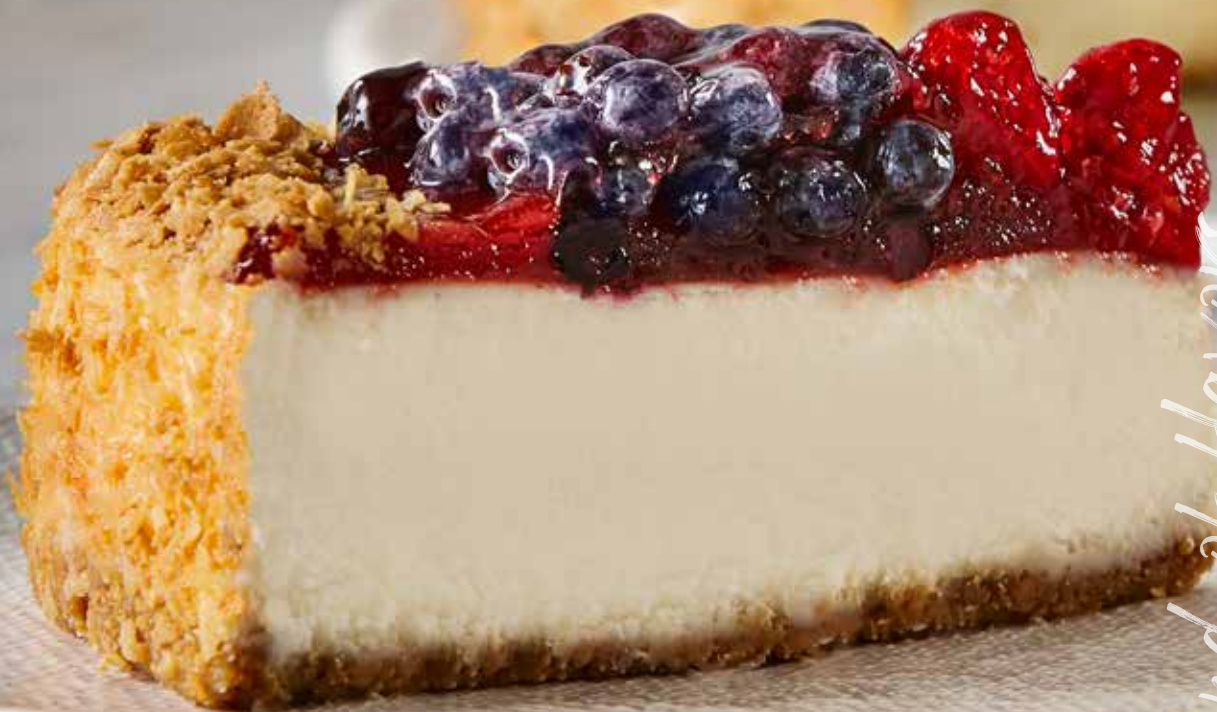
FROMAGE RUBY TUESDAY RUBY TUESDAY CHEESECAKE

Did you know? We use over 30,000 kg of Quebec berries in our desserts each year.