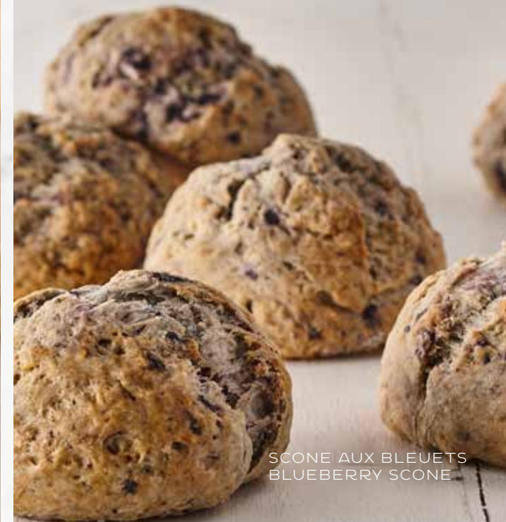
SCONE AUX BLEUETS BLUEBERRY SCONE