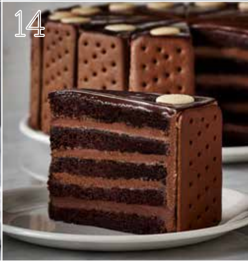
7 CHOCOLAT PRESTIGE CHOCOLATE PRESTIGE #9802

Gâteau au chocolat garni de crème au beurre chocolat et de ganache chocolat. Chocolate cake layered with rich chocolate buttercream and chocolate ganache.