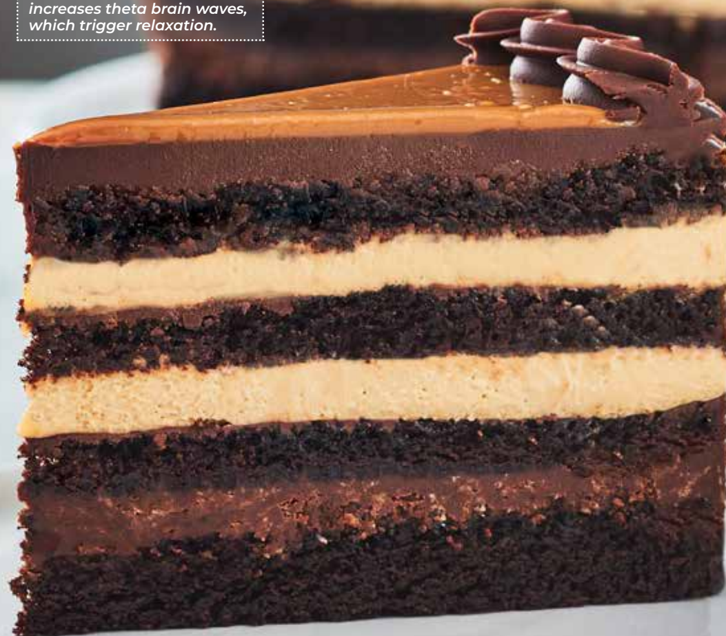
DULCHE DE LECHE

Did you know? The mere smell of chocolate increases theta brain waves, which trigger relaxation.