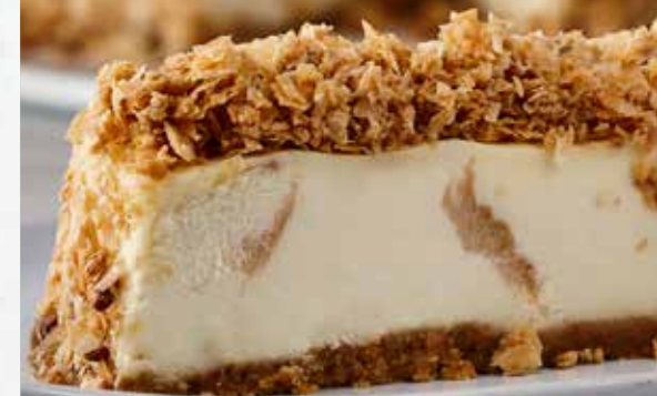
FROMAGE BAKLAVA BAKLAVA CHEESECAKE