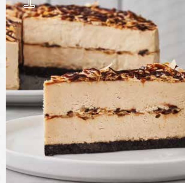
FROMAGE MOKA MOCHA CHEESECAKE