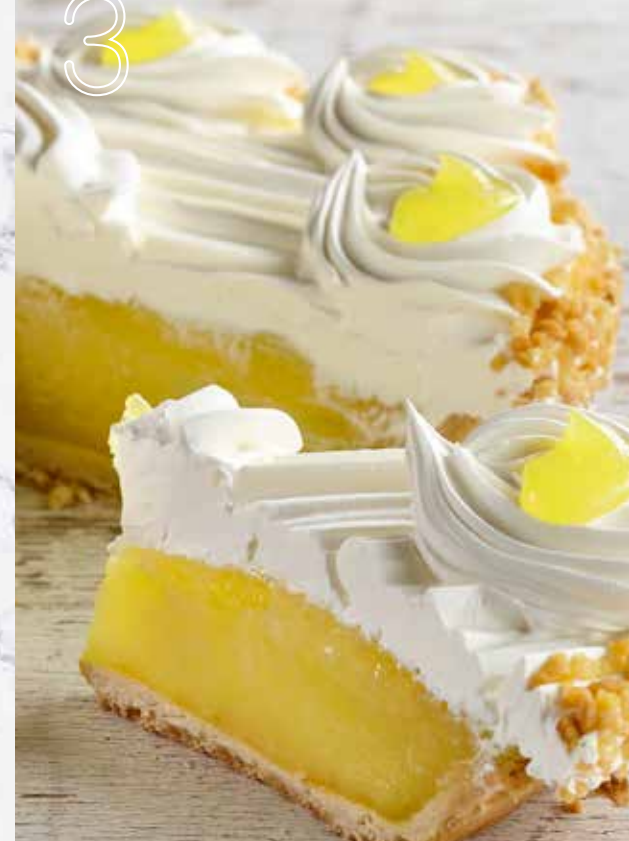
TARTE CITRON TRADITIONNELLE TRADITIONAL LEMON PIE