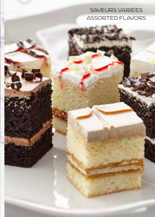
SAVEURS VARIÉES ASSORTED FLAVORS