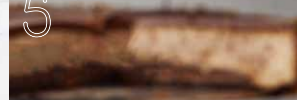
FROMAGE NUCIOLA NUCIOLA CHEESECAKE